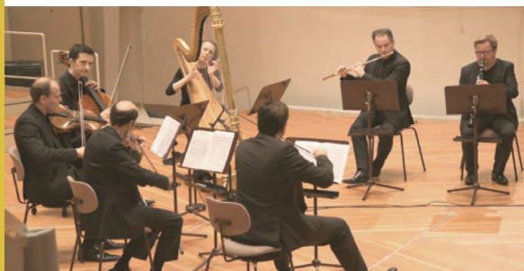
Musiciens de l'Orchestre Philharmonique de Berlin