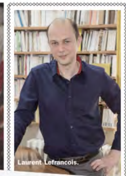
Hauteville House's 'glass look-out', which inspired French composer Laurent Lefrançois to compose Crystal Palace .