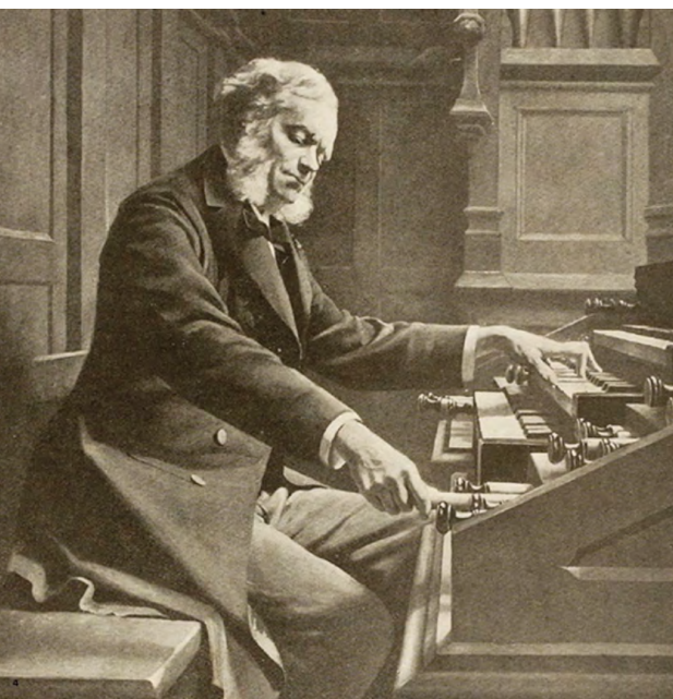
César Franck (1822-1890)

Le label BY Classique en coproduction avec l'Orchestre Philharmonique Royal de Liège auront permis la réalisation de ce coffret de 4 disques qui marquera cette année jubilaire.