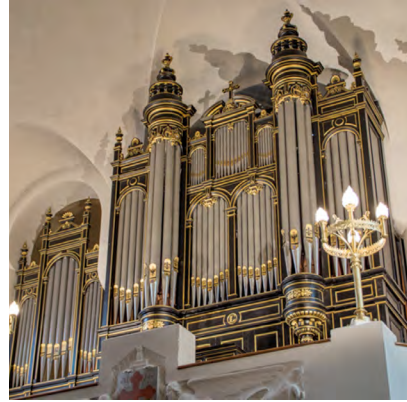
L'orgue Aristide Cavallé-Coll (1865) de l'église Saint-Maurice de Bécon-Courbevoie (Paris)