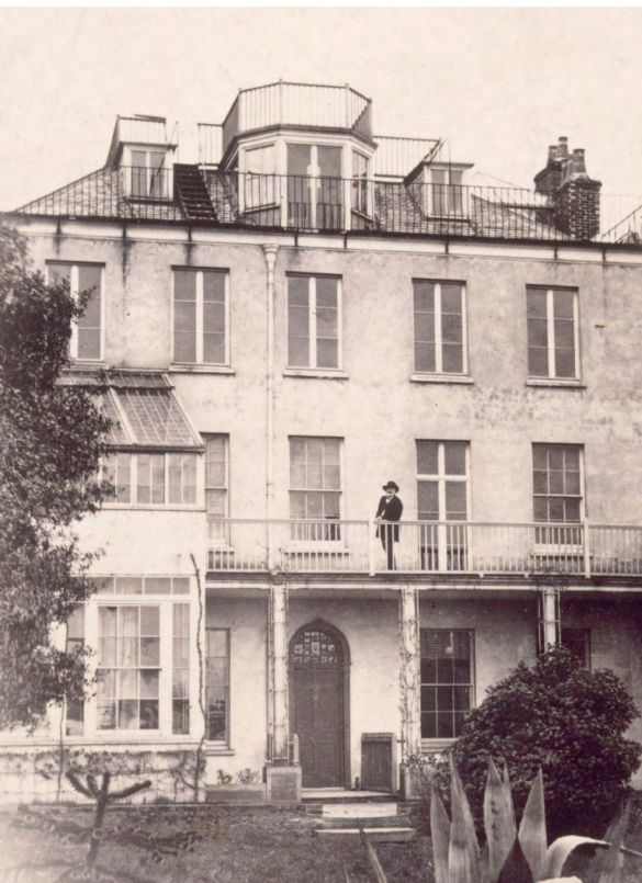
Victor Hugo sur la terrasse de Hauteville House de Guernsey, en exil de 1856 à 1870