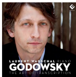
Godowsky, The Art of Transcription