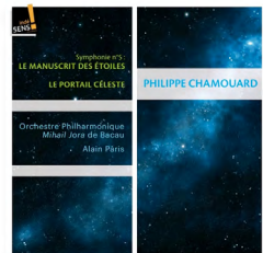
Philippe Chamouard Le Manuscrit des Étoiles : Symphonie n°5 ORCHESTRE PHILHARMONIQUE DE BACAU