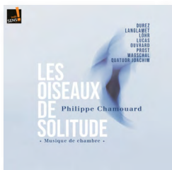
Philippe Chamouard Les Oiseaux de Solitude DUREZ / LANGLAMET / LUCAS / WAGSCHAL...