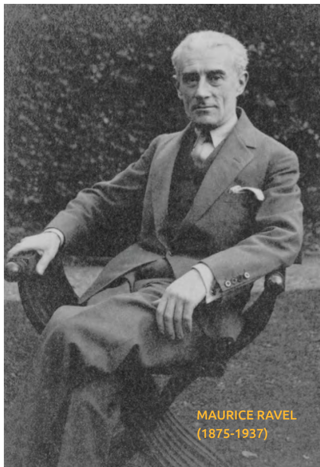
MAURICE RAVEL (1875-1937)