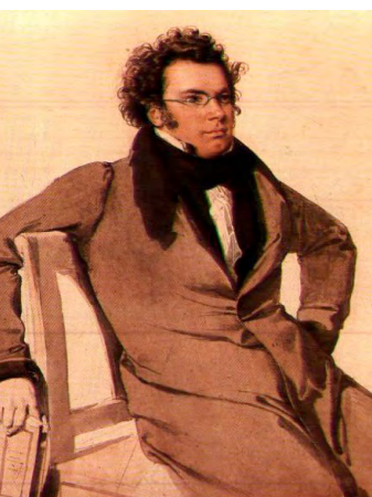
Franz Schubert (1797-1828)

Le deuxième trio à cordes, véritables bijou du même compositeur est une œuvre d’une grande intimité où l’élégance viennoise se mêle avec grâce à la mélancolie schubertienne.”