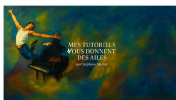
Mes tutoriels vous donnent des ailes