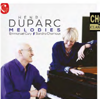
Mélodies de Duparc récompensé d'un Choc Classica