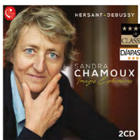
Intégrale des Éphémères de Philippe Hersant et des Images de Debussy obtient 5 étoiles Classica, 4 Diapasons