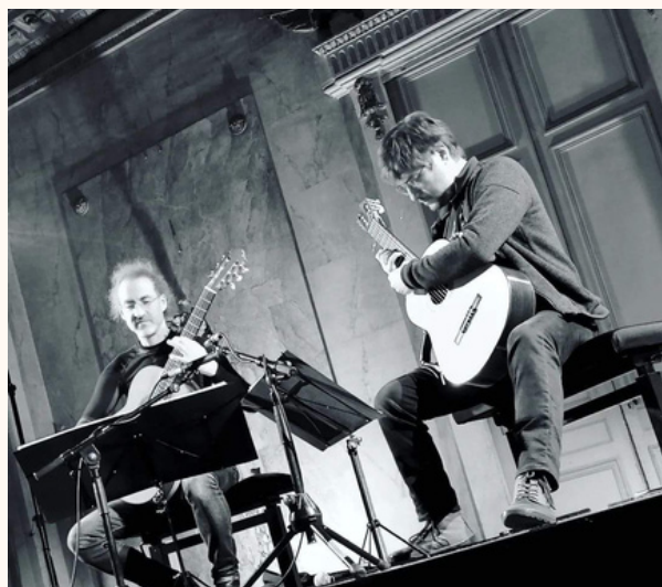
Palais des Ducs, Dijon, Janvier 2023