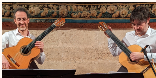
Palais des archevêques, Narbonne, février 2023