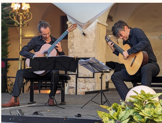
“Nice Classic Festival”, Nice, août 2023