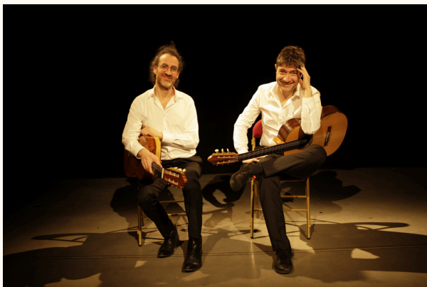
Théâtre la Grange, Luynes, avril 2023